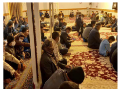
تجمع ابوالفارسی‌ها در حمایت از سرمایه‌گذار پتروپالایشگاه